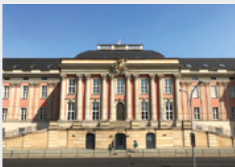
Parlamento di Brandeburgo, Germania - GMA Garnet™ ClassicCut 80 è stato utilizzato per fabbricare staffe di fissaggio progettate su misura per l'estensione del Parlamento.

GMA Garnet™ è un marchio affidabile utilizzato in vari progetti importanti a livello globale, quali la costruzione del nuovo palazzo del Parlamento di Brandeburgo e di strutture aeronautiche commerciali e militari realizzate da Premium Aerotec, una delle principali industrie aerospaziali in Germania.