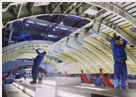
Premium Aerotec, Germania - GMA Garnet™ è la scelta preferita per il taglio di precisione sul titanio dove è richiesto un profilo di alta qualità.